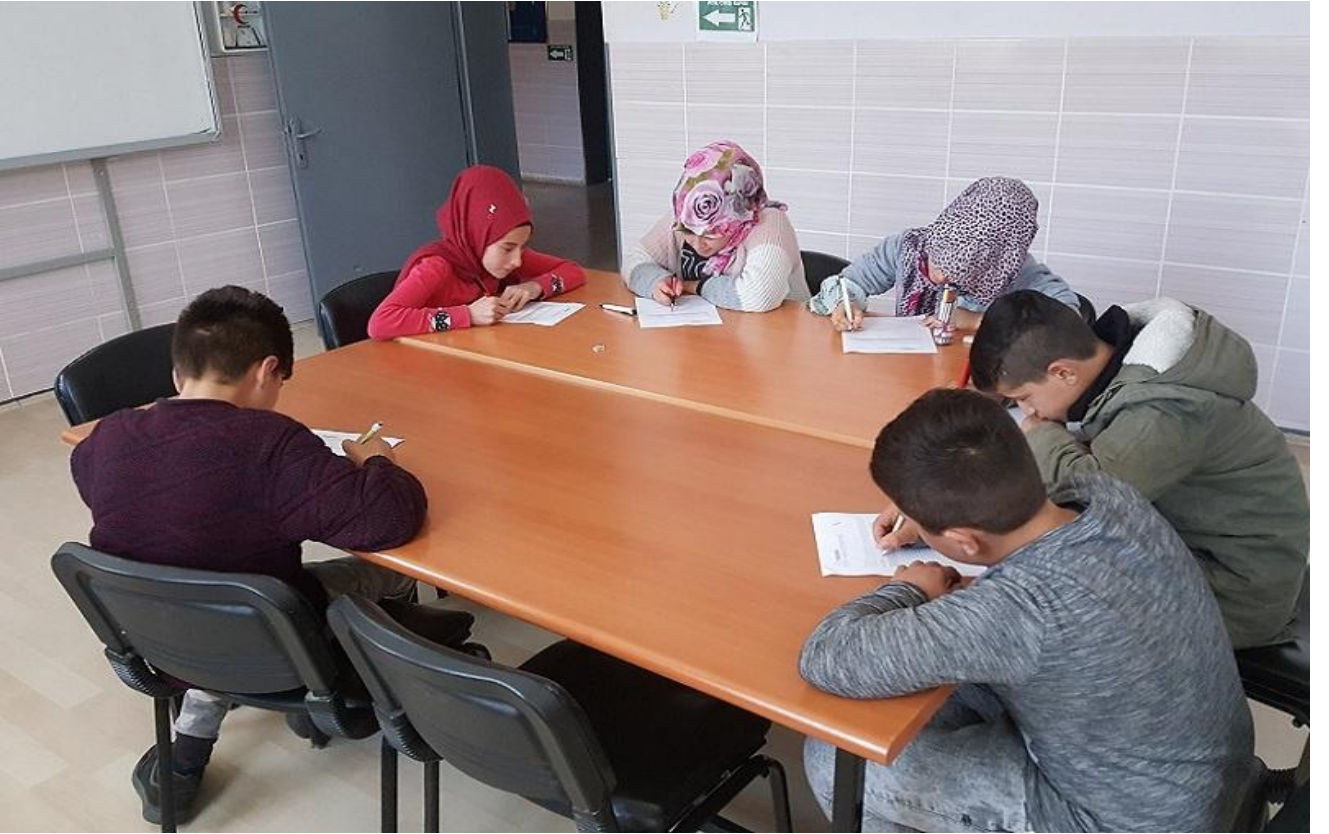
Öğrencilerimize Yapılan Devamsızlık Anketi

Sonuç olarak , okulumuz öğrencilerinin devam-devamsızlık durumları incelendiği zaman genel olarak sorun yaşanmadığı görülmüş olup, devamsızlığı fazla olan öğrenciler konusunda ise gerekli tedbirler alınmıştır.